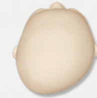
Vorher: lagebedingte Ver- formung des Kopfes

Die Cranioform®-Helmtherapie hat schon vielen Kindern geholfen. Und alle hatten eins gemeinsam: Sie haben sich blitzschnell an den maßgefertigten Helm gewöhnt.