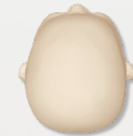
Nachher: per Helmtherapie optimierte Kopfform